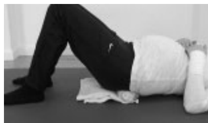
Abbildung 6: Eigenübung: exzentrische Arbeit der lumbalen Muskulatur – Endposition