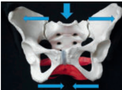
Abbildung 2: Kaudale Verkeilung des Kreuzbeins bei Beckenbodenaktivität