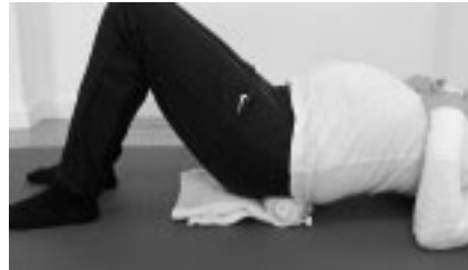
Abbildung 5: Eigenübung: exzentrische Arbeit der lumbalen Muskulatur – Ausgangsposition