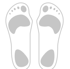
Hohlfuß mit Hammer- bzw. Krallenzehnen