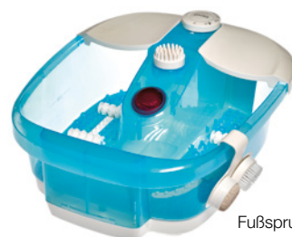
Fußsprudelbad von Promed