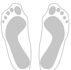
Spreizfuß mit Hallux valgus