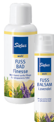
Pflegender Fußbalsam und Badezusatz von Sixtus