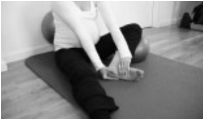
Abbildung 3: Ausgangsstellung Übung Fuß-Schraube