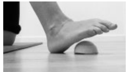
Abbildung 11: Ausgangsstellung Übung Fuß-Krake