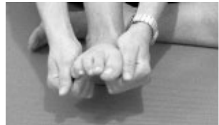
Abbildung 10: Endstellung der Übung