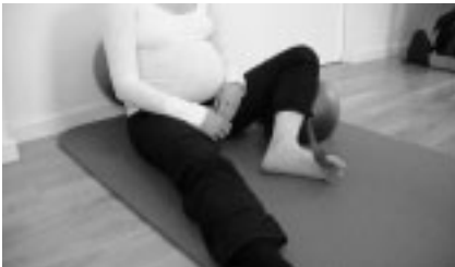
Abbildung 5: Ausgangsstellung Übung Fuß-Zug