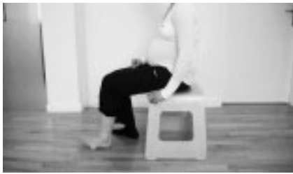
Abbildung 13: Ausgangsstellung Übung Fuß-Krake im Sitzen