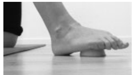
Abbildung 12: Endstellung der Übung