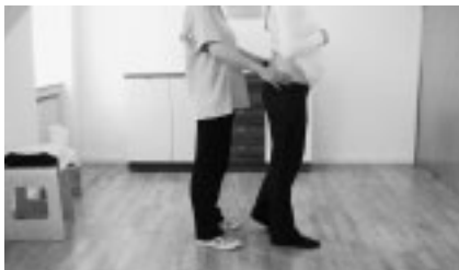
Abbildung 15: Ausgangsstellung Integration Wirbelsäule und Fuß in Gang