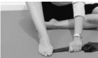
Abbildung 8: Endstellung der Übung