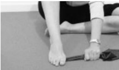
Abbildung 7: Ausgangsstellung Übung Fuß-Pendel