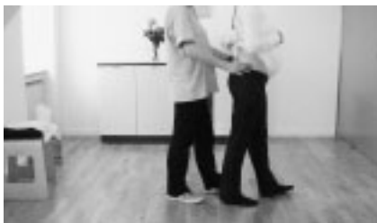
Abbildung 16: Endstellung der Übung

gebautem Quergewölbe aus dem Sprunggelenk nach oben. Spüren Sie dabei, wie Sie mehr Anstrengung brauchen, um die Position beizubehalten, je weiter Sie den Fuß heben. Versuchen Sie nicht, den Gegenstand mit den Zehen aufzugreifen (siehe Abbildungen 11 und 12). Mit der Hand können Sie die Bewegung des Fußes nachahmen, um mehr Bewegungsinformation für den Fuß zu generieren (siehe Abbildungen 13 und 14).