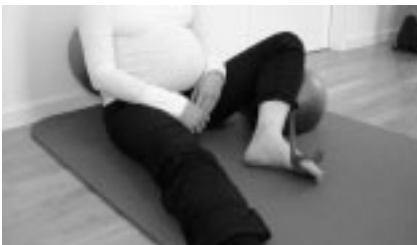
Abbildung 6: Endstellung der Übung