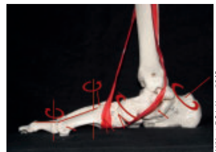
Abbildung 2: Pathomechanischer Pfad bei Verlust der Verschraubung,